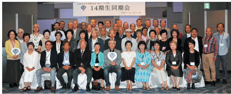
平成27年6月28日(日)あべのハルカス20階にあるマリオット都ホテルの宴会場で14期生同期会を行いました。幸い天気にも恵まれ高層から阿倍野界隈の景色を楽しむことが出来ました。毎年6月に開催している同期の会ですが今年も一年ぶりに会う友との語り合いの経過も忘れ、また尻取りゲームやハーモニカ演奏もあつて楽しいひと時を過ごしました。2次会参加の希望者はハルカス近くのカフェバーに場を移し、ここでも飲み放題