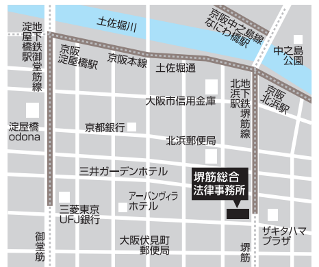
(地下鉄堺筋線北浜駅下車6番出口すぐ)

弁護士5名、事務員3名の計8名で執務しています。当事務所が扱っている主要な案件は、不動産・売買・賃貸等、金融、保険、労務、債券回収、交通事故、離婚や相続等多岐にわたります。今年には金融法務に関する著書もある弁護士が新たに加入することで、業務の幅を広げ、多様な案件に対応できるよう心掛けております。